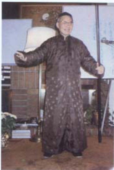
下·陳上師講經之神采 上·陳上師在香港放生三船共計六萬命